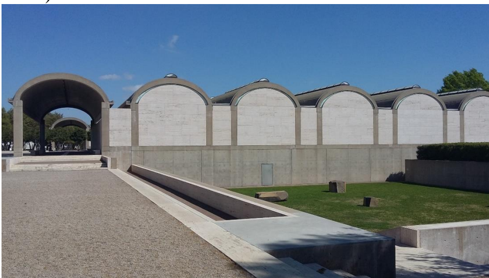
Kimbelli kunstimuuseum.