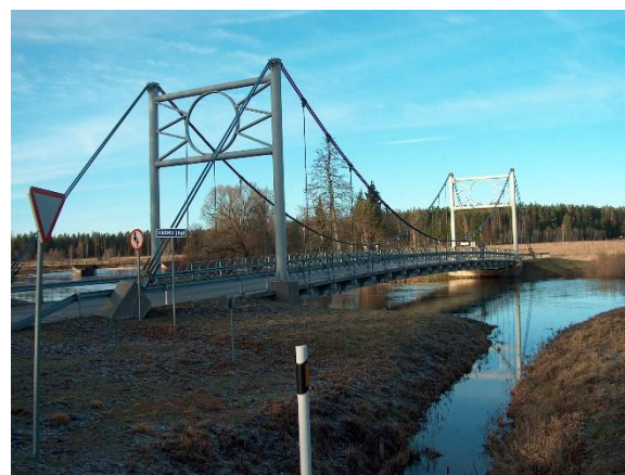
Kurgja sild. Projekt ja foto: Siim Idnurm