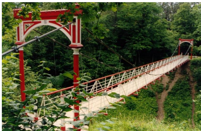
Viljandi ripp-sild ehitati 1897. aastal. Viimane renoveerimine 1995. Tugevdusprojekti autorid Valdek Kulbach ja Siim Idnurm